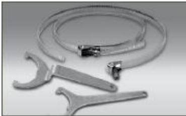
B-4, B-10, B-21... coliere de fixare din oțel inoxidabil pentru montarea kiturilor nemetalice Thermon pe țevi.

B-4 ...pentru țevi cu diametru de până la 100 mm