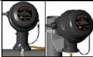
Montare pe țevă Montare pe perete

Următoarele informații se referă la kiturile de alimentare, kiturile de terminație, precum și accesoriile comune de instalare, folosite pentru cablurile electrice de încălzire Thermon BSX™, RSX™, KSX™, HTSX™, VSX™, FP și HPT.