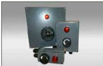
CS-L-*Ex.... Comutator circuit cu lampă. Poate fi monopolar, bipolar, tripolar. Disponibil în versiunile 16A, 25A și 40A.