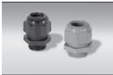
M25-SX-Ex Presetupă nemetalică certificată Ex e pentru utilizarea cu cutiile de joncțiune M25.

BSK.....IEK-SXM KSX, HTSX, FP, HPT.....IEK-SXS RSX, VSX.....IEK-SXL TESH.....IEK-TEs