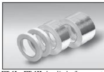
FT-1L, FT-1H ...bandă de fixare pentru montarea cablului pe conducte la fiecare 300 mm sau conform codului sau specificațiilor.

M25-LN-IND ...contrapiuliță pentru fixarea presetupelor M25 în cutiile JB-K-1 și JB-K-2.