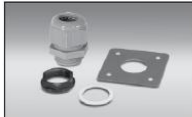
IEK-SK ... kit de intrare izolație pentru utilizare în spații cu (fără) risc exploziv, care protejează și izolează cablul de încălzire, penetrând în același timp învelișul izolației.

Terminator LN-Tool ...pentru strângerea contrapiulițelor kiturilor terminatorului. Instrumentul este recomandat pentru a se asigura că armătura este corect fixată pe suportul montat pe conductă.