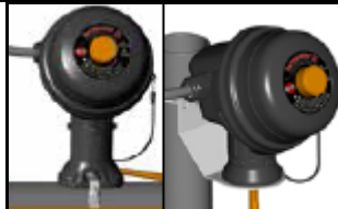
Montare pe țevă Montare pe perete

ZS/ZE-XP .....BSX, RSX, HTSX, KSX, VSX, FP, HPT