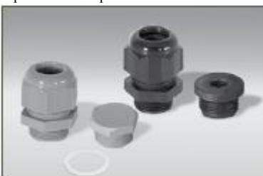
M25-PWR-Exe, M25-B-Exe... ... presetupă și dop nemetalice certificate Ex e pentru utilizarea cu cutia terminator.

BSX..... M25-SXM KSX, HTSX, FP, HPT.....M25-SXS RSX, VSX..... M25-SXL TESH.....M20-PWR-